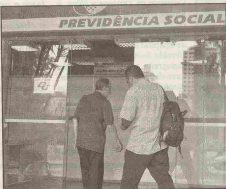
Peritos do INSS pedem mais tempo para o atendimento